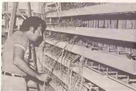
E trabowan di instalacion di e sistema nobo di telefon entrega door di Philips ta progresando. Milles y Milles di waya mester worde conecta na e aparatonan nobo den e centralnan cual ta worde haci cu asistencia di e personal di Telefoondienst.

mester drel of primi boton, dependiendo ki tipo di telefon ta ser usa. Cu e sistema nobo ta posible pa reduci numbernan largo asina den forma di un codigo di solamente 2 of 3 cifra. Esaki ta reduci e chens di haci errornan ora ta yama numbernan largo y ta reduci e tempo pa haci e comunicacion necesario.